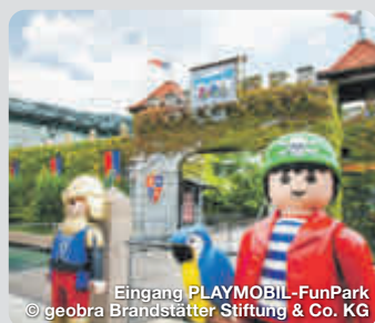
Eingang PLAYMOBIL-FunPark