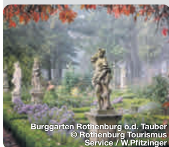
Burggarten Rothenburg o.d. Tauber

Mit dem Naturpark Frankenhöhe im Norden, dem Hesselberg im Süden und vielen kleinen Dörfern, bestimmt eine weitläufige Natur das Bild der sanften Mittelgebirgslandschaft im Romantischen Franken. Das große historische Erbe zeigt sich in den ehemaligen Reichsstädten, den früheren Klöstern und in der Markgrafenresidenz Ansbach. Die Städte im Romantischen Franken sind Glanzpunkte deutscher Städtebaukunst. Beeindruckende Fachwerkhäuser, geschlossene Stadtmauern, verwinkelte Gassen, Tore und Türme aus dem Mittelalter bestimmen die Stadtbilder. Die berühmte alte Reichsstadt Rothenburg ob der Tauber thront hoch über dem Fluss und ist Romantik pur. TreffpunktDeutschland.de/romantisches-franken