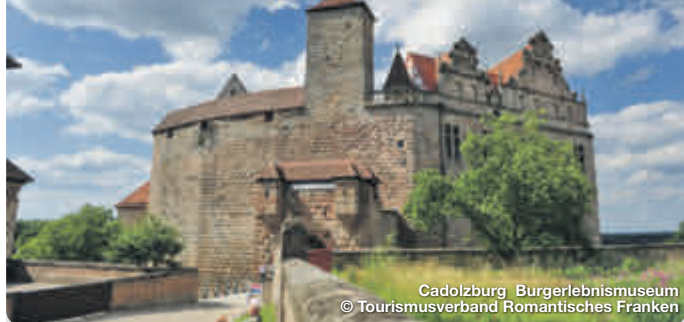
Cadolzburg Bürgerlebnismuseum

Mit dem Naturpark Frankenhöhe im Norden, dem Hesselberg im Süden und vielen kleinen Dörfern, bestimmt eine weitläufige Natur das Bild der sanften Mittelgebirgslandschaft im Romantischen Franken. Das große historische Erbe zeigt sich in den ehemaligen Reichsstädten, den früheren Klöstern und in der Markgrafenresidenz Ansbach. Die Städte im Romantischen Franken sind Glanzpunkte deutscher Städtebaukunst. Beeindruckende Fachwerkhäuser, geschlossene Stadtmauern, verwinkelte Gassen, Tore und Türme aus dem Mittelalter bestimmen die Stadtbilder. Die berühmte alte Reichsstadt Rothenburg ob der Tauber thront hoch über dem Fluss und ist Romantik pur. TreffpunktDeutschland.de/romantisches-franken