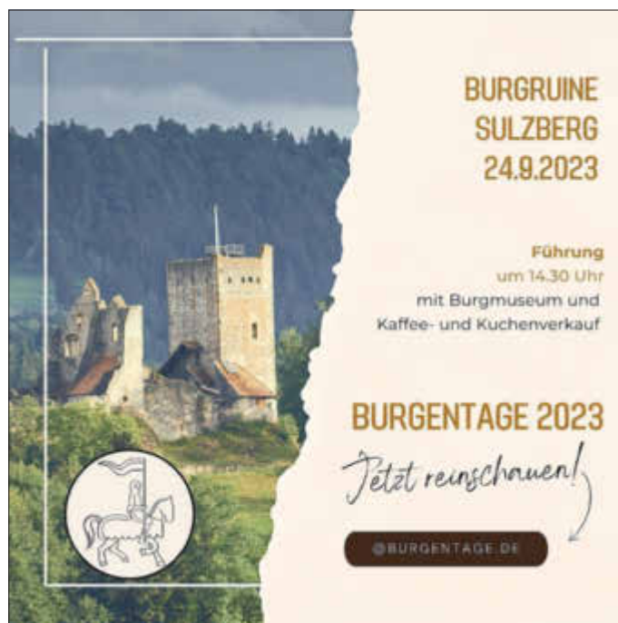
Gerhard Frey, 1. Bürgermeister

Die Feuerwehr Moosbach-Untergassen e.V. lädt am Sonntag, den 24. September 2023 ab 10 Uhr zum Herbstmarkt im Feuerwehrhaus Moosbach ein. Neben handgemachten Waren und Basteleien gibt es Feuerwehr-Kinderspiele. Für das leibliche Wohl und musikalische Unterhaltung mit dem Alpkraimer Trio ist bestens gesorgt.