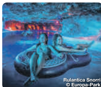
Rulantica Snorri