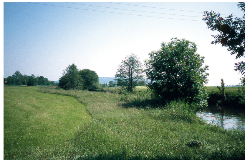
Gewässerrandstreifen mit Beschattung für das Gewässer

Für die einhergehenden Einschränkungen bisher zulässiger und tatsächlich ausgeübter Nutzungen aufgrund der gesetzlichen Vorgaben zum 5 Meter-Gewässerrandstreifen soll nach Maßgabe der verfügbaren Haushaltsmittel ein angemessener Geldausgleich gewährt werden. Die Grundlage für die Ausgleichszahlungen wurde bis Ende 2019 gemeinsam durch die Bayerischen Staatsministerien für Ernährung, Landwirtschaft und Forsten sowie Umwelt und Verbraucherschutz geschaffen. Die geplanten Ausgleichszahlungen sind beihilferelevant, weshalb ein EU-Notifizierungsverfahren erforderlich ist. Die Vorlage der Unterlagen bei der EU-Kommission erfolgte über das Bundesministerium für Ernährung und Landwirtschaft im Januar 2020. Erfahrungsgemäß ist für das Notifizierungsverfahren von Seiten der EU mindestens ein Jahr anzusetzen.