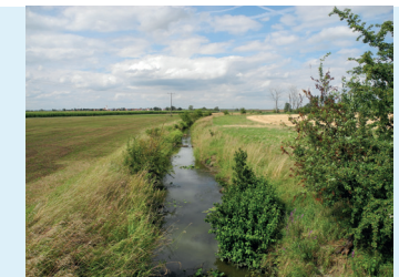
Gewässer mit Gewässerrandstreifen