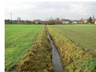
Gewässer ohne Gewässerrandstreifen