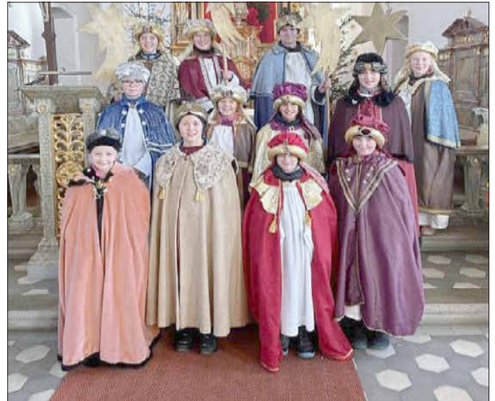
Sternsinger – Moosbach