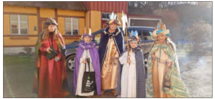
Sternsinger – Ottacker -