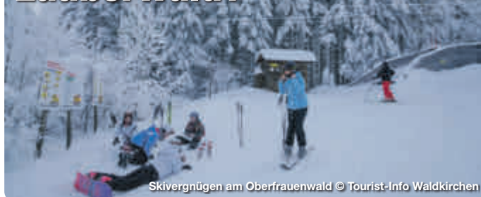
Skivergnügen am Oberfrauenwald

Karoli-Badepark, über 100 markierte Wanderkilometer, Hängepartien im Kletterwald und ein Abenteuerspielplatz im Wald – in Waldkirchen im Bayerischen Wald treffen Familien mit Kindern auf ein großes Freizeitangebot bei kurzen Wegen. Auch im Winter ist das charmante Städtchen am Nationalpark Bayerischer Wald eine Reise wert: Das Skigebiet Oberfrauenwald mit Schlepplift und Rodelbahn ist bestens für Skianfänger geeignet.