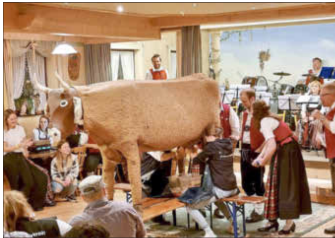
Die 3. Disziplin am Bockbierfest - das Melken.

Wir möchten und hiermit nochmals herzlich bei den vielen Teilnehmern und Zuschauern für den gelungenen Abend bedanken und beglückwünschen nochmals alle Sieger!