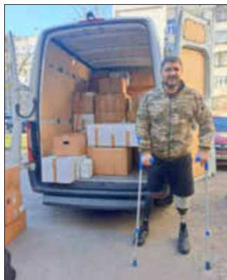
Petro verteilt Lebensmittel.

Die Menschen in der Ukraine brauchen auch im 3. Kriegsjahr weiterhin unsere Unterstützung. Sie sollen wissen, dass wir sie nicht vergessen.