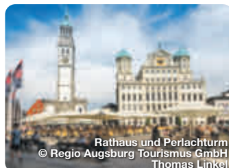
Rathaus und Perlachturm