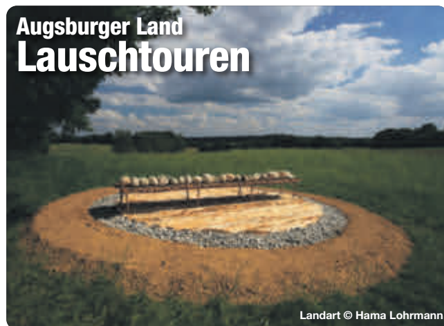
Landart © Hama Lohrmann

Mit dem Audioguide auf den Spuren großer Persönlichkeiten wandern und dabei spannende Erlebnisse und unterhaltsame Geschichten hören. Alles was Sie dafür benötigen ist die kostenlose Bayerisch-Schwaben-Lauschtour App. Mit dem GPS werden die Lauschpunkte automatisch abgespielt – gehen Sie die Tour also in Ihrem eigenen Tempo. Unser Tipp: Die Touren funktionieren auch offline. Am besten lädt man die Tour bereits zu Hause im WLAN herunter.