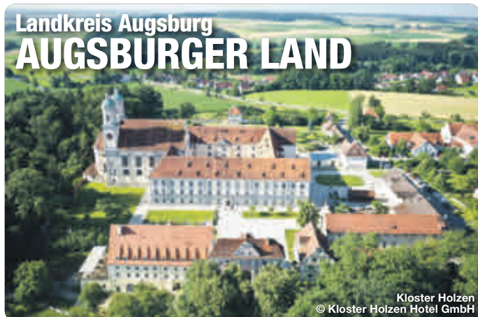
Kloster Holzen

Das Augsburger Land. Mit seiner reichen Geschichte, seiner vielfältigen Kultur und Landschaft ist das Augsburger Land ein attraktives Ziel für ein paar Tage Entspannung. Der Naturpark Augsburg - Westliche Wälder ist die grüne Lunge und lädt zum Naturerlebnis und zur Entschleunigung ein. Die Flüsse Lech und Wertach prägen die Landschaft und bieten zahlreiche Möglichkeiten zum Wandern und Radfahren. Ein vielseitiges Kulturangebot und Freizeitspaß sowie familienfreundliche Angebote und Aktivitäten bei abwechslungsreichen Ausflugszielen bieten ein Urlaubsfeeling im Grünen – ganz ohne Trubel.