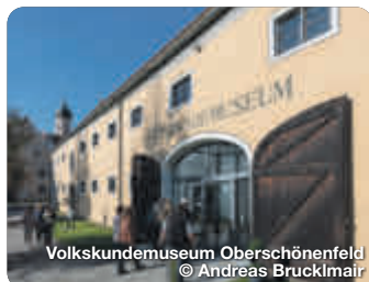
Volkskundemuseum Oberschönenfeld