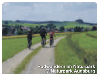
Radwandern im Naturpark

TreffpunktDeutschland.de/augsburger-land