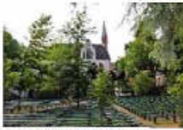
Kirche mit Pilgerplatz, Marienthal

Das Kloster Marienthal ist einer der ältesten Wallfahrtsorte in Deutschland.